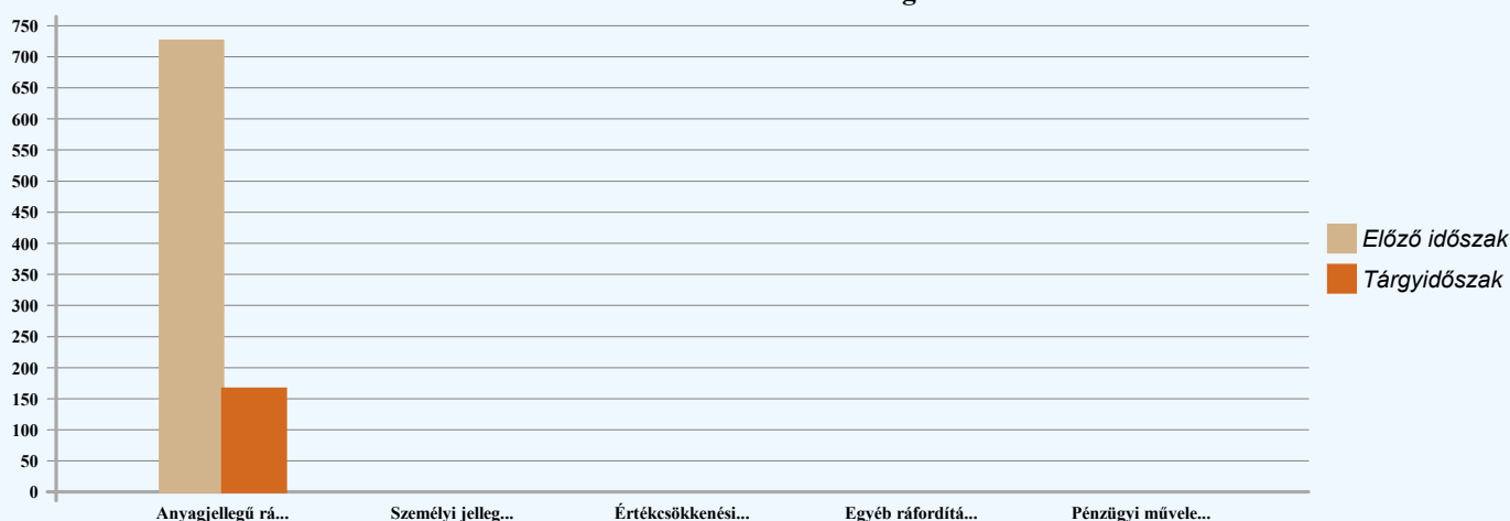
Ráfordítások alakulása és megoszlása